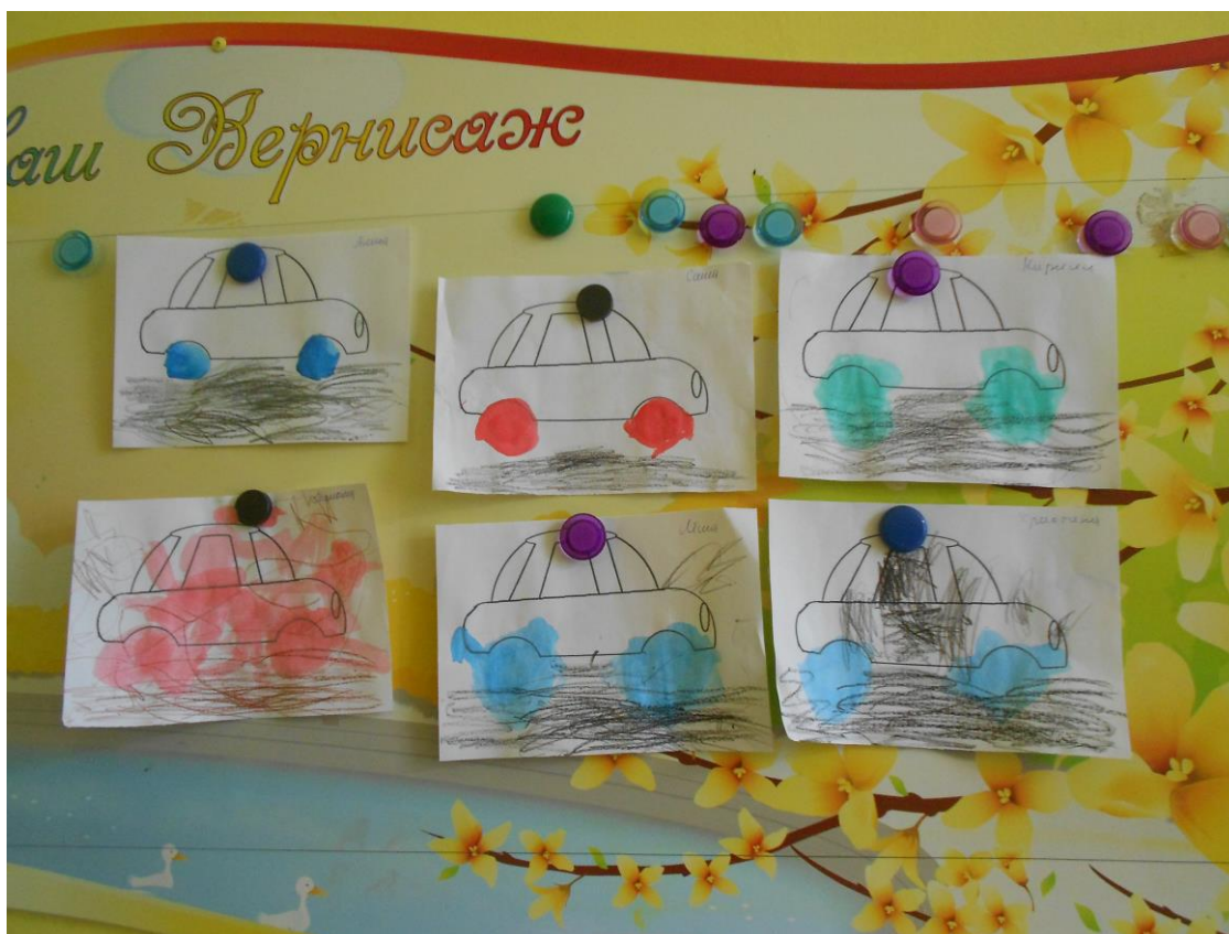
Катятся машинки по дорожке