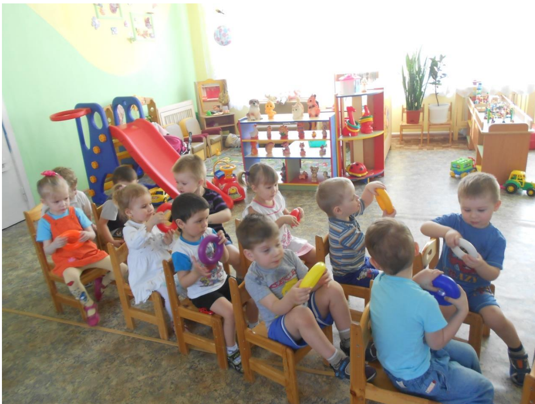
Подвижная игра «Автомобили»