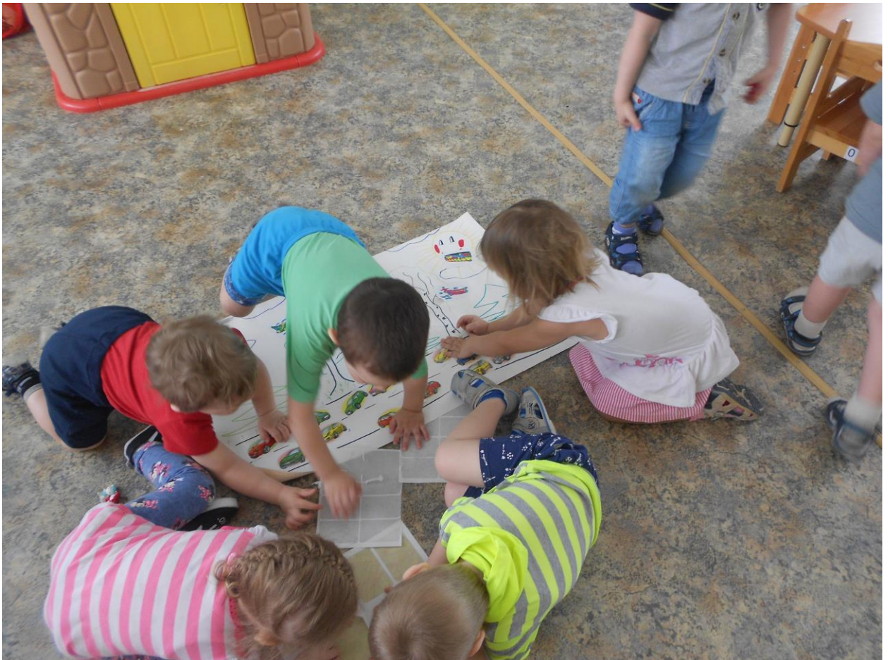
Коллективная работа (оформление плаката) «Быстрые машинки»