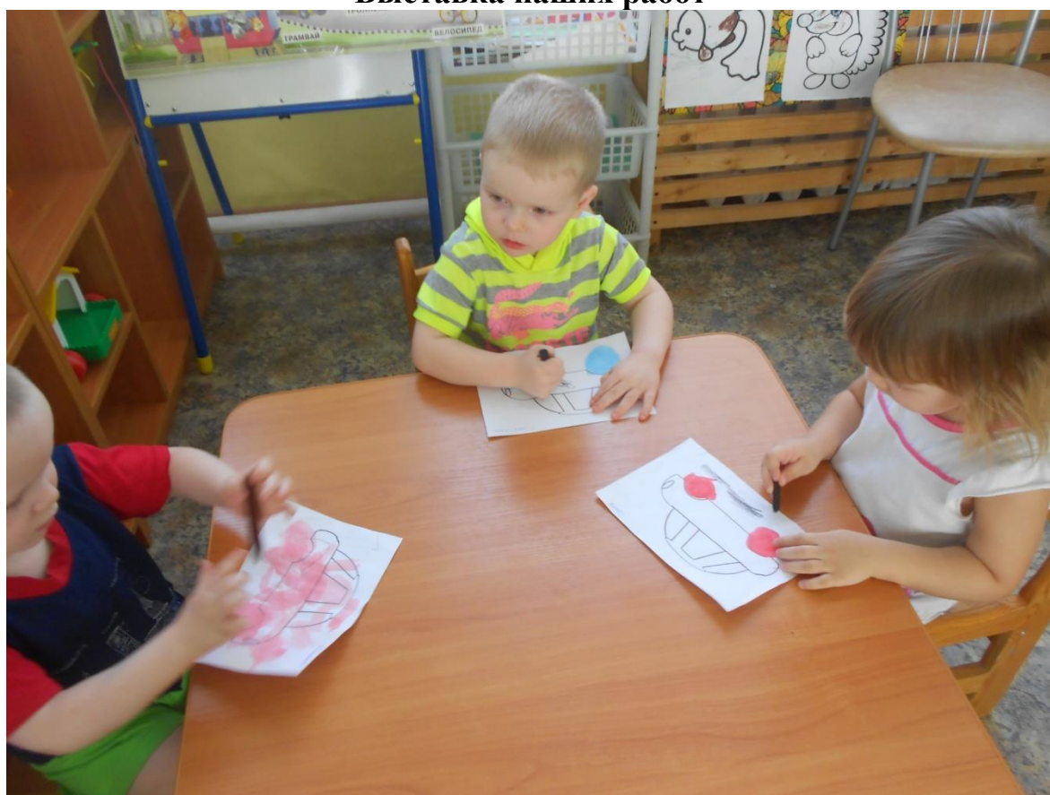
Рисование мелками «Дорожка для машин»