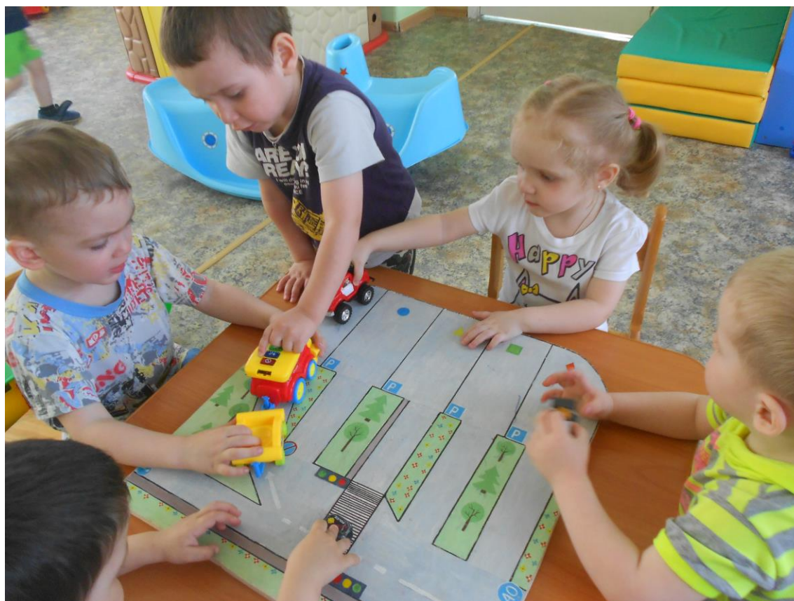
Изготовление родителями макета улицы и проезжей части