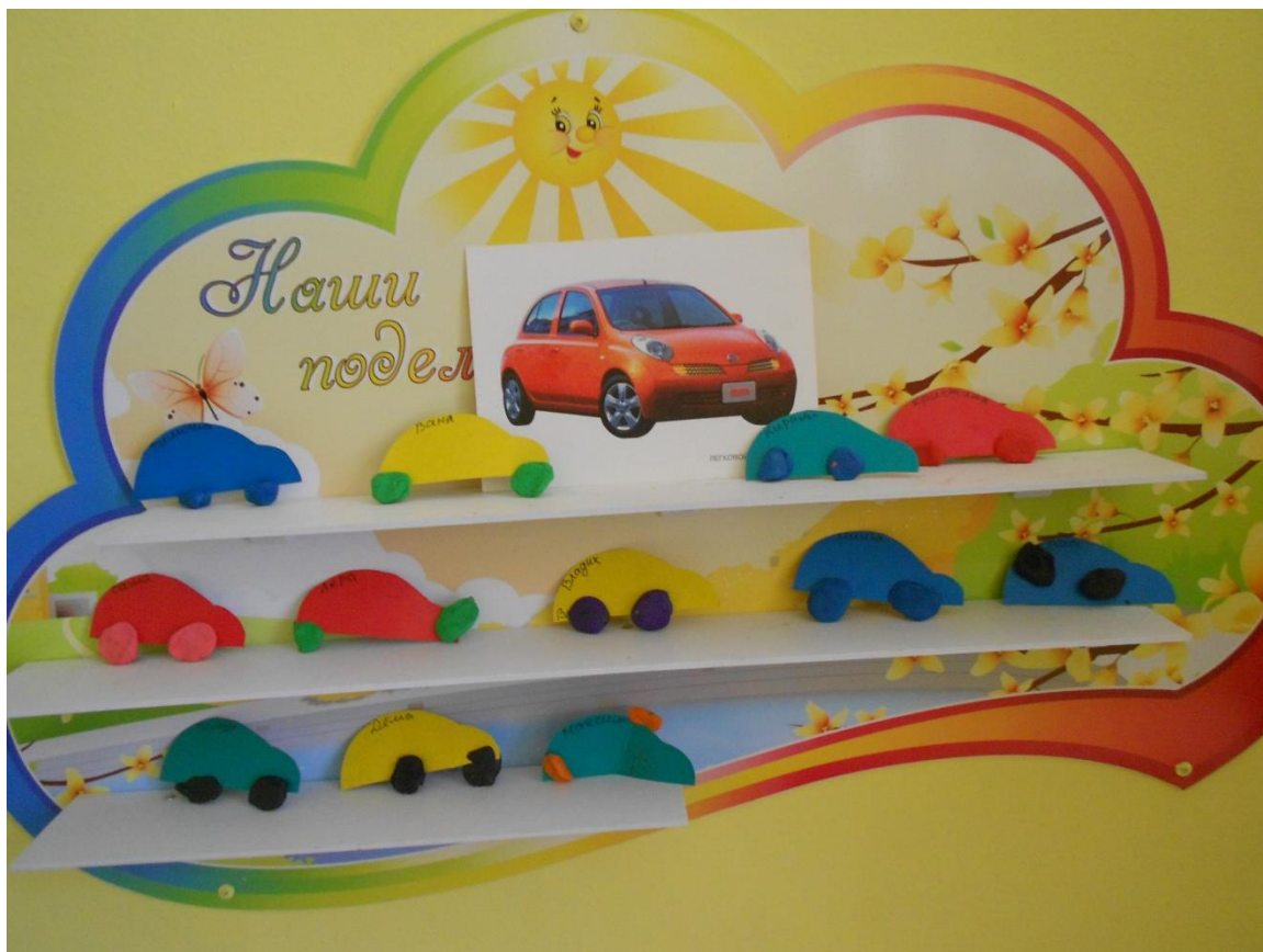
Лепка «Разноцветные колеса»