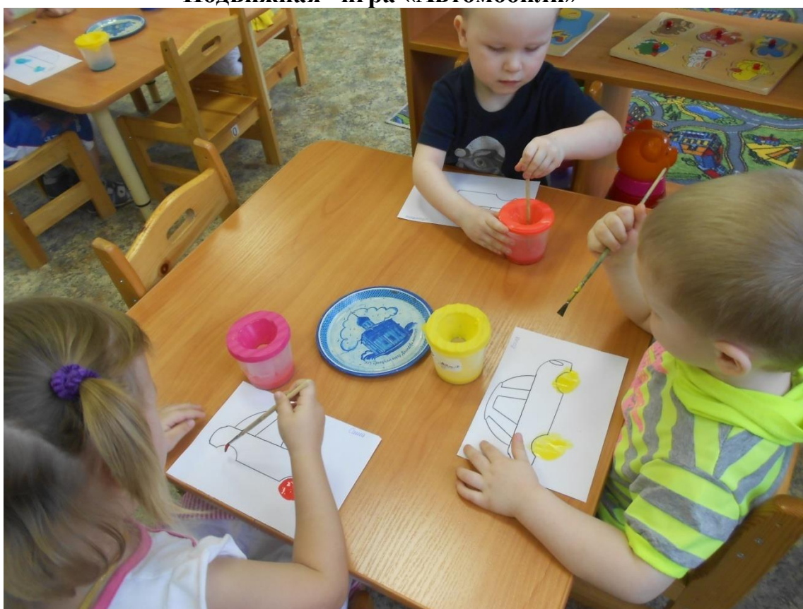
Рисование «Колеса для машины»