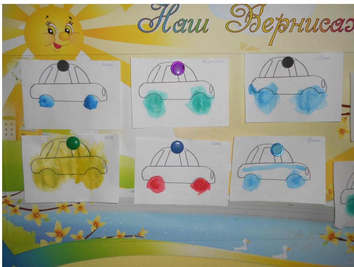
Выставка наших работ