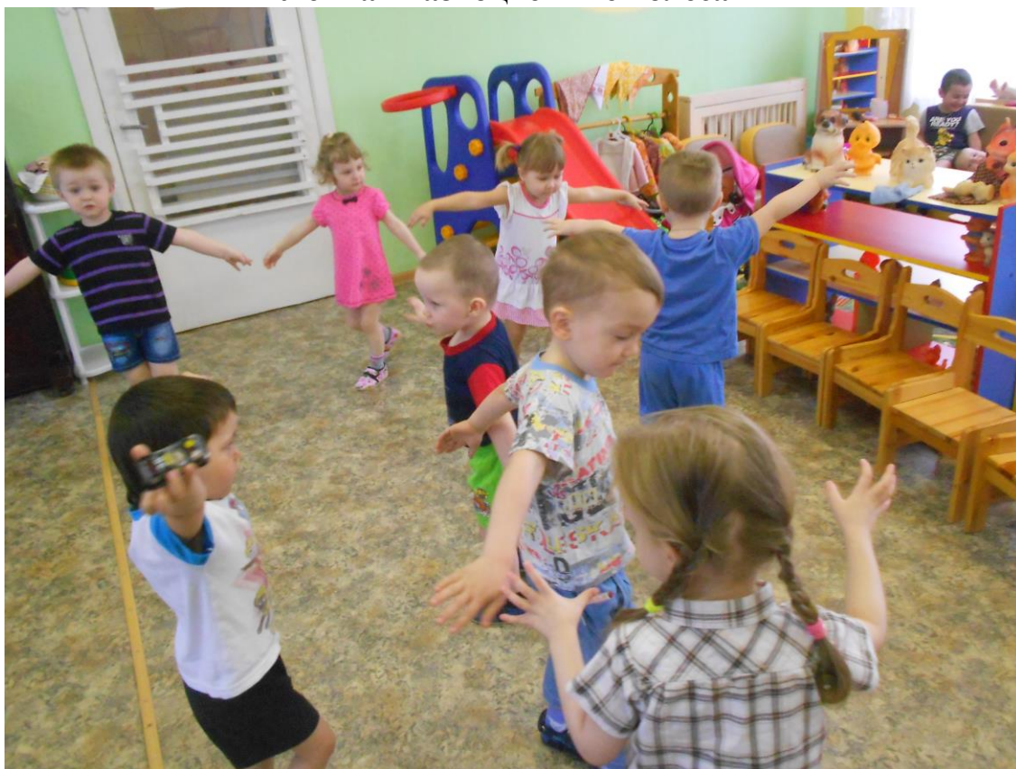
Подвижная игра «Самолеты»